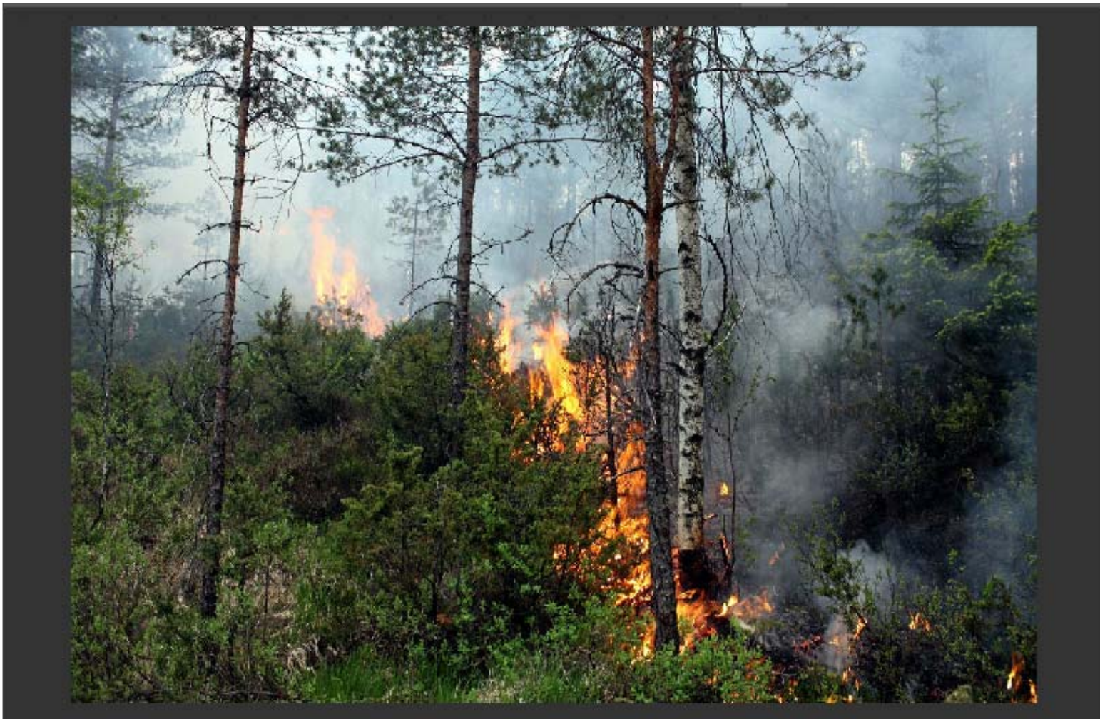
Brannen ved Bjelland i Marnardal.